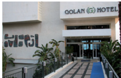
HOTEL GOLAN - TIBERÍADES