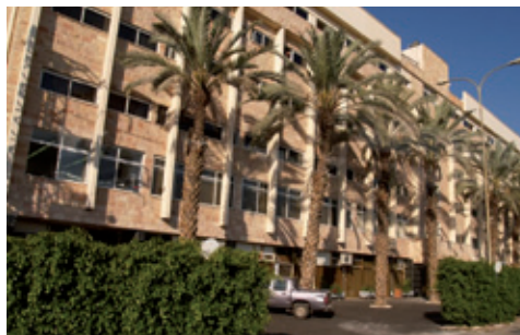
HOTEL RESTAL - TIBERÍADES