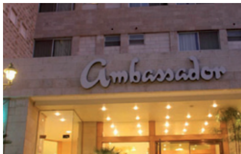
HOTEL AMBASSADOR - JERUSALÉN